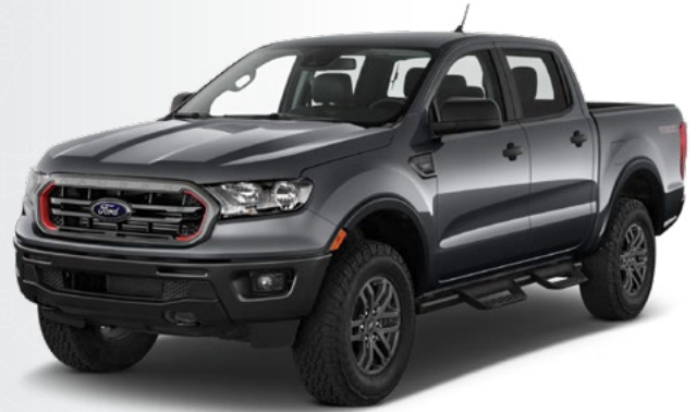
Ford Ranger 2019 y más recientes