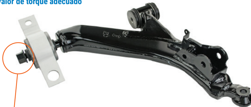
Figura 2: Debe ser apretado después de la instalación del brazo de control en la altura correcta de la marcha