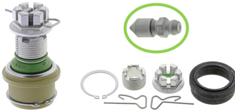
Figura 1. El paquete de hardware cuenta con un conector de grasa tipo purga incluido (dentro del círculo)

Este conector de grasa tipo purga es compatible con todos los acoplamientos de pistola engrasadora para una amplia compatibilidad. Vea la Figura 2.