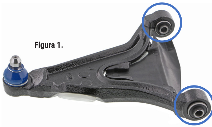
Figura 1. Tipo 1: comúnmente se denomina "Estilo de 2 pernos", ya que se requieren 2 pernos del buje al bastidor.

Para realizar una reparación sin contratiempos, una comparación visual rápida del brazo de control instalado actualmente ayudará a determinar cuál tipo se requiere. Vea en la Figura 1 y 2 una ilustración de la diferencia.