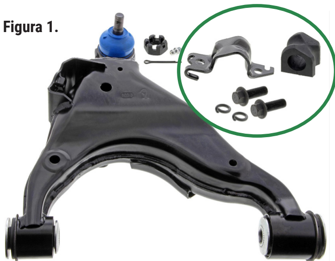
Figura 1. Conjunto del brazo de control delantero inferior Supreme de Mevotech CMS861082 con componentes adicionales para vehículos equipados con sistema KDSS (dentro del círculo)

Estos componentes adicionales son solo para vehículos equipados con el sistema KDSS. No intente instalar estos componentes adicionales en vehículos que no están equipados con el sistema KDSS. Verifique el tipo de suspensión antes de la instalación.