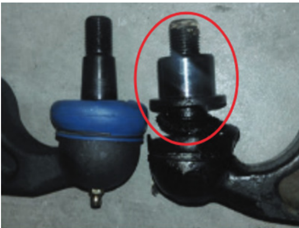
Figura 1. Brazo de control original con inserto atrapado en el perno (dentro del círculo rojo).

En algunos casos, cuando se retira el brazo de control original para reemplazarlo, el inserto del muñón de dirección puede quedar atrapado en el perno de unión de la junta esférica debido al óxido y a la corrosión. Vea la Figura 1.