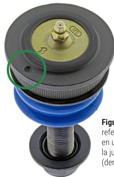
Figura 2. Marca de referencia perforada en una brida de la junta esférica (dentro del círculo)