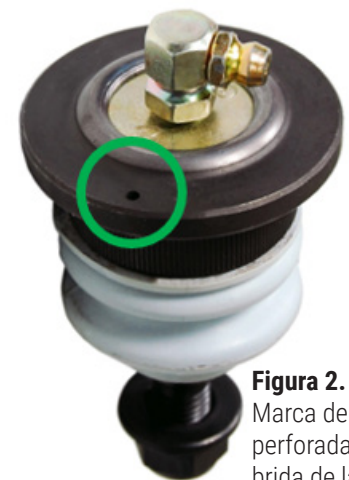
Figura 2. Marca de referencia perforada en una brida de la junta esférica (dentro del círculo)