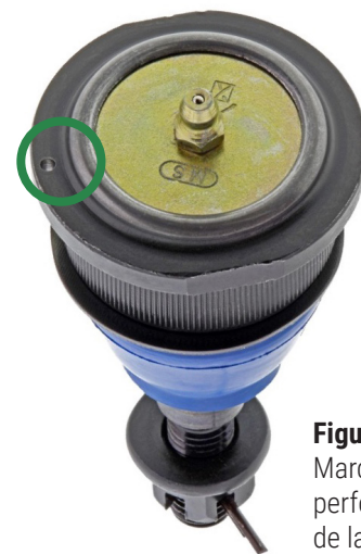
Figura 2. Marca de referencia perforada en una brida de la junta esférica (dentro del círculo)