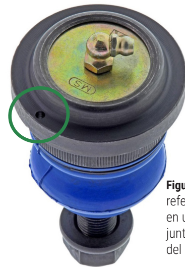
Figura 2. Marca de referencia perforada en una brida de la junta esférica (dentro del círculo)