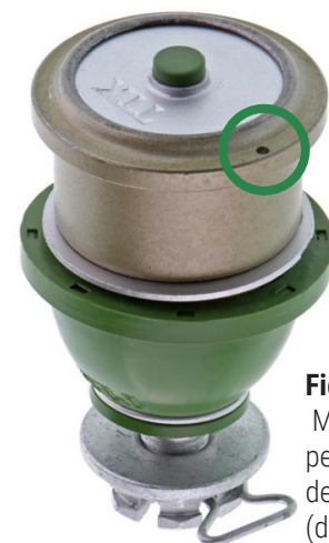
Figura 2. Marca de referencia perforada en una brida de la junta esférica (dentro del círculo)