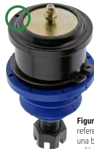
Figura 2. Marca de referencia perforada en una brida de la junta esférica (dentro del círculo)