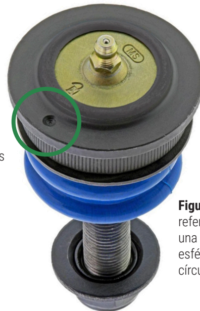
Figura 2. Marca de referencia perforada en una brida de la junta esférica (dentro del círculo)