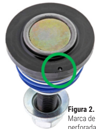
Figura 2. Marca de referencia perforada en una brida de la junta esférica (dentro del círculo)