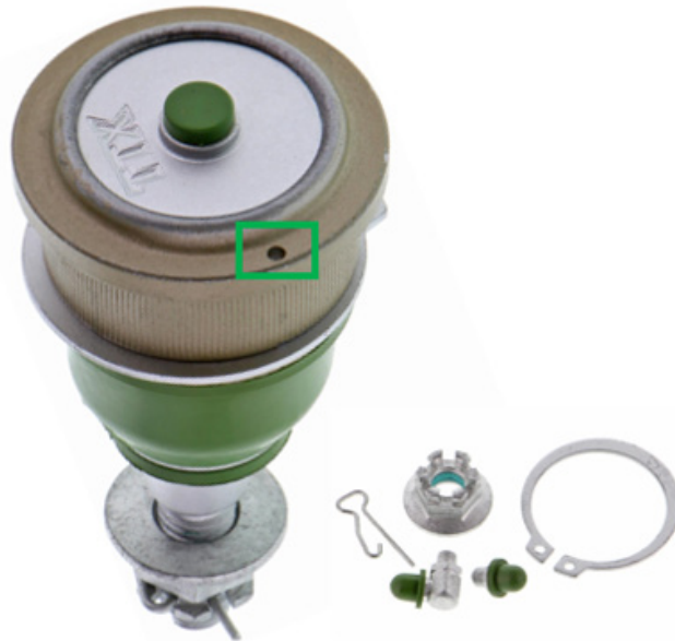
Figura 2. Marca de referencia perforada en una brida de la junta esférica (dentro del cuadro)