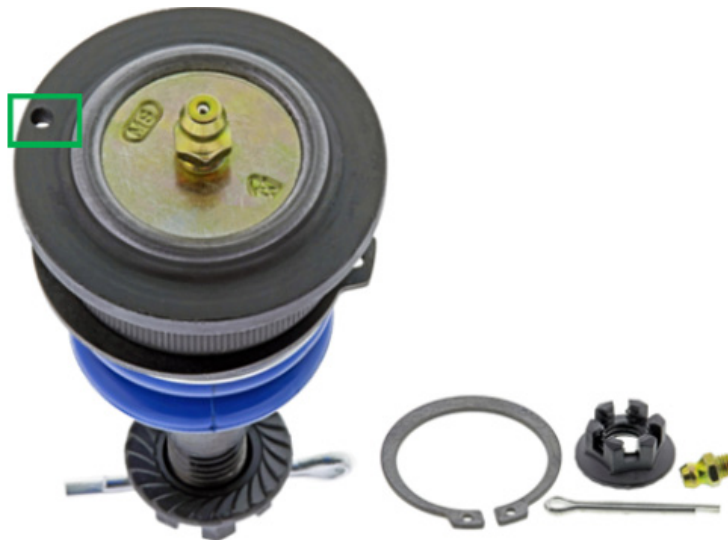
Figura 2. Marca de referencia perforada en una brida de la junta esférica (dentro del cuadro)