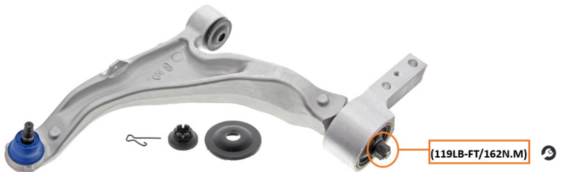
Figura 1. La tuerca del soporte del buje (encerrada en un círculo arriba) debe apretarse correctamente después de colocar el brazo de control en el vehículo