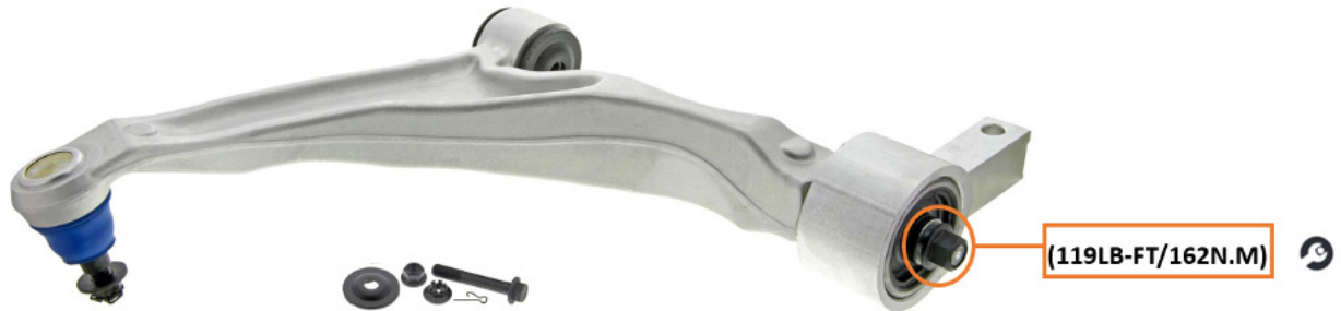
Figura 1. La tuerca del soporte del buje (encerrada en un círculo arriba) debe apretarse correctamente después de colocar el brazo de control en el vehículo