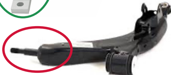
Figura 1. Conjunto del brazo de control Supreme de Mevotech con buje de conformidad preinstalado (arriba) vs conjunto de brazo de control estilo equipo original (abajo)