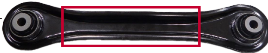
Figura 1. El brazo de control trasero inferior hacia adelante Supreme de Mevotech CMS601237 con perfil de estampado mejorado y refuerzo adicional (arriba) vs diseño de fabricante de equipo original (abajo)