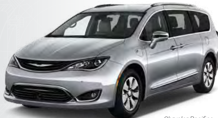
Chrysler Pacifica 2017-2019