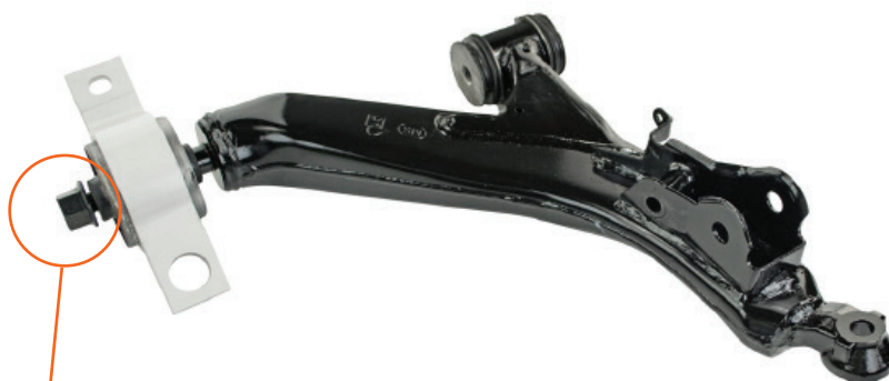
Figure 1 : Ce boulon est fourni à titre de pièce détachée dans la boîte