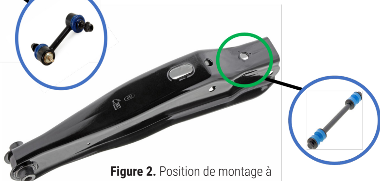
Figure 2. Position de montage à l'extérieur de la barre de suspension de type 2 sur la pièce CMS501232