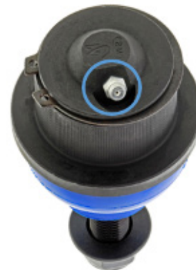
Figure 1. Pour assurer un dégagement adéquat entre les composants et permettre une accessibilité lors des prochains entretiens de lubrification, le joint à rotule doit être installé parallèlement à la languette d'arrêt du bras de suspension inférieur avant.

Toujours consulter le manuel de réparation de l'usine pour connaître les procédures de diagnostic, les méthodes de retrait et d'installation de composants et les procédures et valeurs de couple de fixation adéquates, le cas échéant. Utiliser uniquement une clé dynamométrique étalonnée pour le serrage final.