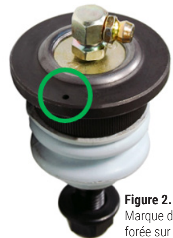
Figure 2. Marque de repère forée sur la bride du joint à rotule (encerclée)