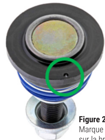
Figure 2. Marque de repère forée sur la bride du joint à rotule (encerclée)