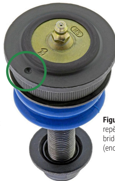
Figure 2. Marque de repère forée sur la bride du joint à rotule (encerclée)