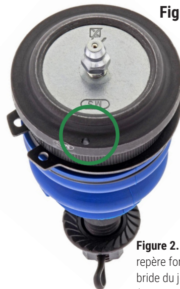
Figure 2. Marque de repère forée sur la bride du joint à rotule (encerclée)