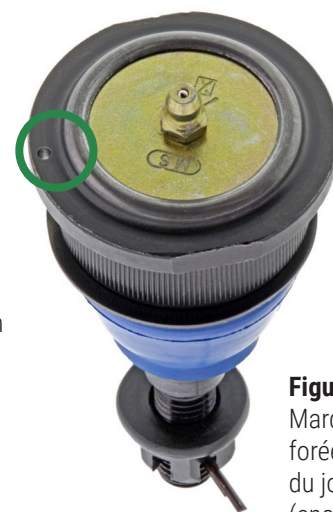
Figure 2. Marque de repère forée sur la bride du joint à rotule (encerclée)