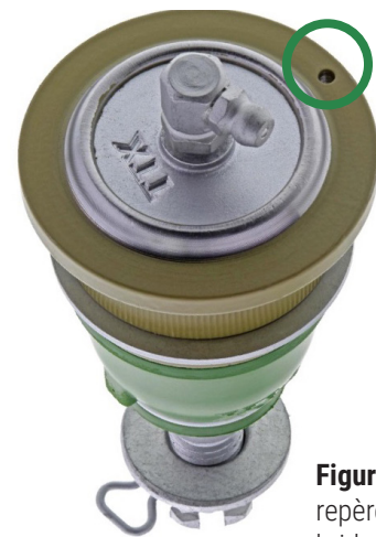
Figure 2. Marque de repère forée sur la bride du joint à rotule (encerclée)