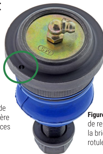
Figure 2. Marque de repère forée sur la bride du joint à rotule (encerclée)