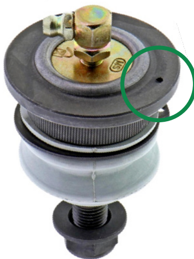
Figure 1. Repère du joint à rotule. Dans cet exemple, le repère est un trou.