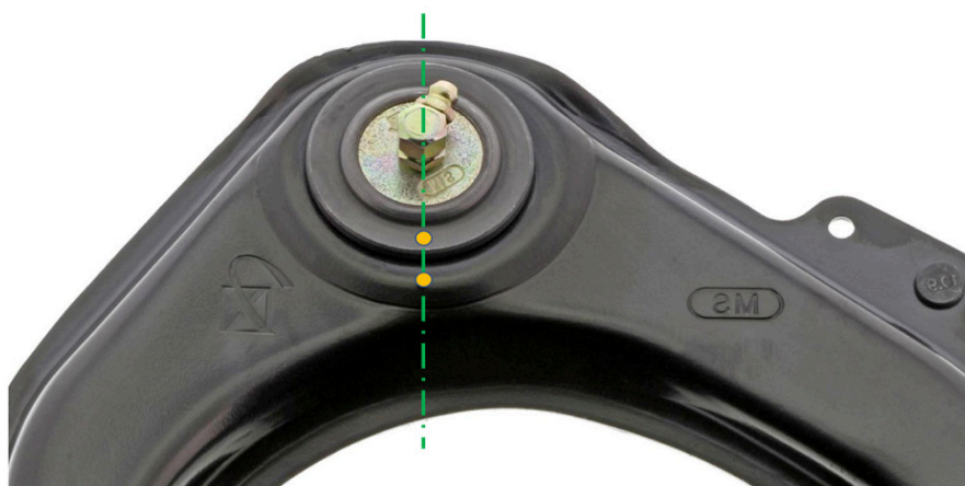
Figure 3. L'orientation correcte de l'installation est obtenue lorsque le repère du joint à rotule aligné avec le repère du côté du bras de suspension.

Toujours consulter le manuel de réparation de l'usine pour connaître les procédures de diagnostic, les méthodes de retrait et d'installation de composants et les procédures et valeurs de couple des fixations adéquates, selon le cas.