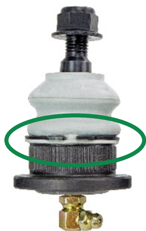
Figure 1. Le circlip est bien fixé au soufflet. Le circlip et le soufflet sont bien positionnés sur la rainure usinée du carter.

Les étapes ci-dessus sont illustrées à la Figure 2.