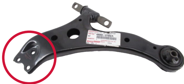
Figure 1. Bras de suspension Mevotech Supreme CMS86181 avec joint à rotule prémonté et matériel inclus (en haut) comparativement au bras de suspension d'origine nu (en bas)

Ligne directe du soutien technique : 1 844 383-7268 Pour les pièces, visiter : mevotech.com Numéro de publication : MXF-21-123-02-01-FR