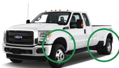
Figure 1 : Essieu à voie large avec gros élargisseurs.

Au moment de remplacer les rotules de biellette de direction sur les Ford F-350 fabriqués entre 2005 et 2016, il est important de vérifier le type d'essieu dont le véhicule est muni. Il existe deux types d'essieux différents : à voie large ( figure 1 ) et non à voie large ( figure 2 ). Chaque type est muni d'une rotule de biellette de direction de diamètre différent et elles ne sont pas interchangeables.