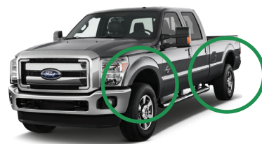
Figure 2 : Essieu non à voie large avec élargisseurs d'aile ordinaires et roue arrière simple