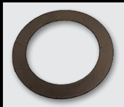
Ressort disque Belleville

Les ressorts disque Belleville sont des rondelles de forme conique, généralement présentes dans les composants du châssis. Grâce à leur forme conique et à leur profil résistant aux chocs, ils fournissent la tension nécessaire pour maintenir le joint à rotule en contact.