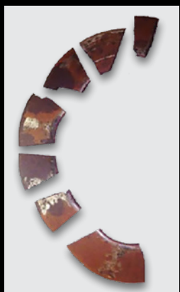
Ressort disque défaillant

Les ressorts disque Belleville sont des rondelles de forme conique, généralement présentes dans les composants du châssis. Grâce à leur forme conique et à leur profil résistant aux chocs, ils fournissent la tension nécessaire pour maintenir le joint à rotule en contact.