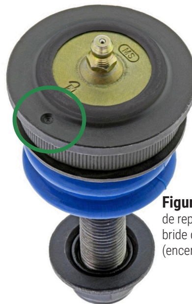
Figure 2. Marque de repère forée sur la bride du joint à rotule (encerclée)