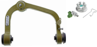
CTXK80306/CTXK80308 - PIÈCE SUPÉRIEURE AVANT GAUCHE/DROITE FORD F-150 2020 À 2004