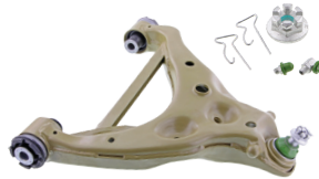
CTXMS401114/CTXMS401115 - PIÈCE INFÉRIEURE AVANT GAUCHE/DROITE FORD F-150 2015 À 2014