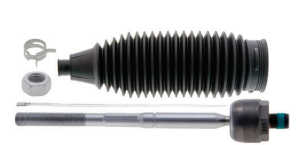
TXMS40708 - INTÉRIEUR AVANT FORD F-150 2016 À 2009