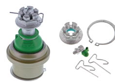
TXMS40529 - PIÈCE INFÉRIEURE AVANT SVT RAPTOR 2014 À 2010