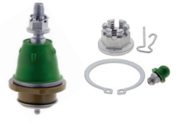
TXMS40557 - PARTIE SUPÉRIEURE AVANT SVT RAPTOR 2020 À 2017