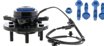
TXF40325 - PIÈCE AVANT FORD F-150 À QUATRE ROUES MOTRICES 2017 À 2015