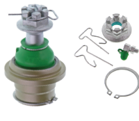
TXK500008 - PIÈCE INFÉRIEURE AVANT FORD F-150 2014 À 2009