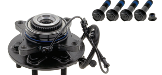
TXF40334 - AVANT FORD F-150 2020 À 2018