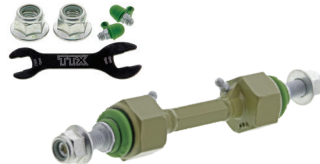
TXMS40836 - PIÈCE AVANT FORD F-150 2020 À 2009