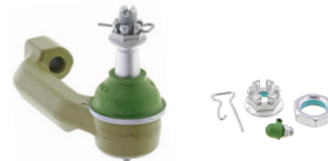
TXMS40602/TXMS40603 - PIÈCE EXTÉRIEURE AVANT GAUCHE/DROITE FORD F-150 2019 À 2009