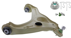
CTXMS40170/CTXMS40171 - PIÈCE INFÉRIEURE AVANT GAUCHE/DROITE FORD F-150 2013 À 2009