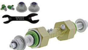
TXMS40820 - PIÈCE AVANT FORD F-150 2020 À 2009