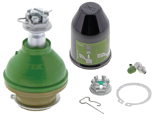
TXMS40546 - PARTIE SUPÉRIEURE AVANT FORD F-150 2020 À 2004