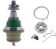
TXMS40531 - PIÈCE INFÉRIEURE AVANT FORD F-150 2019 À 2015