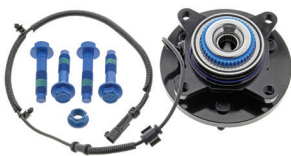
TXF40302 - PIÈCE AVANT FORD F-150 À QUATRE ROUES MOTRICES 2014 À 2011