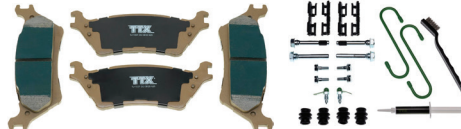
TXBCP1602 - FORMULE CERAPHITE™ TXBPC1602 - FORMULE CÉRAMIQUE PREMIUM TXBPM1602 - FORMULE PREMIUM MET™ TXBPM1602 - FORMULE PREMIUM MET™ TXBSM1602 - FORMULE SUPERMET™

FORD F-150 2014 À 2012 FORD F-150 2020 À 2015 AVEC FREIN DE STATIONNEMENT MANUEL