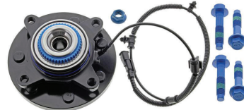
TXF40304 - PIÈCE AVANT FORD F-150 2014 À 2011 AVEC ENSEMBLE DE CHARGE UTILE SUPÉRIEURE