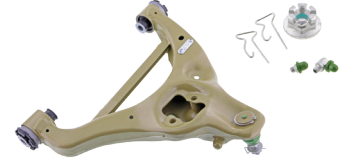
CTXMS401205/CTXMS401206 - PIÈCE INFÉRIEURE AVANT GAUCHE/DROITE FORD F-150 2019 À 2015