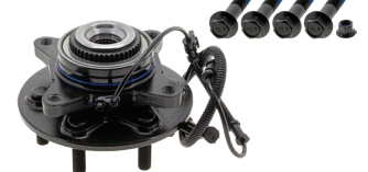
TXF40334 - DELANTERO FORD F-150 2020-2018