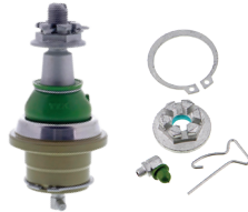
TXMS40531 - FRONTAL INFERIOR FORD F-150 2020-2015