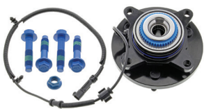
TXF40302 - FRONTAL FORD F-150 4WD 2014-2011