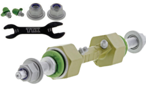
TXMS40820 - FRONTAL FORD F-150 2020-2009