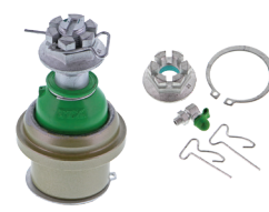
TXMS40529 - FRONTAL INFERIOR SVT RAPTOR 2014-2010