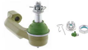
TXMS40602/ TXMS40603 - FRONTAL I/D EXTERIOR FORD F-150 2019-2009