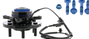
TXF40325 - FRONTAL FORD F-150 4WD 2017-2015