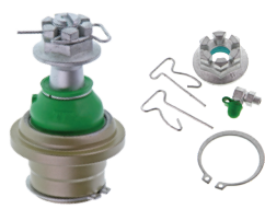
TXK500008 - FRONTAL INFERIOR FORD F-150 2014-2009