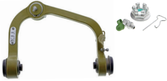
CTXK80306/CTXK80308 - FRONTAL SUPERIOR I/D FORD F-150 2020-2004