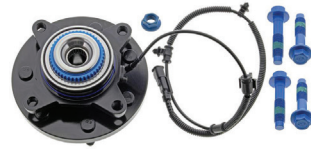
TXF40304 - FRONTAL FORD F-150 2014-2011 C/CARGA ÚTIL DE SERVICIO PESADO