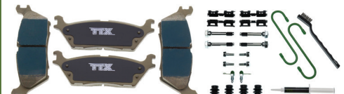
TXBCP1790 - FÓRMULA CERAPHITE™ TXBPC1790 - FÓRMULA CERÁMICA PREMIUM TXBPM1790 - FÓRMULA PREMIUM MET™ TXBSM1790 - FÓRMULA SUPERMET™