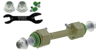
TXMS40836 - FRONTAL FORD F-150 2020-2009