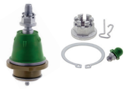
TXMS40557 - PARTE SUPERIOR DELANTERA SVT RAPTOR 2020-2017