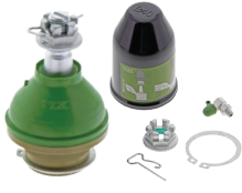
TXMS40546 - FRONTAL SUPERIOR FORD F-150 2020-2004