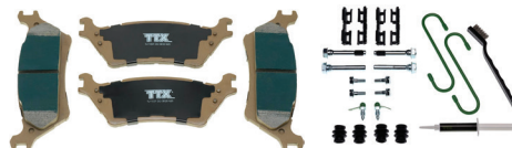
TXBCP1602 - FÓRMULA CERAPHITE™ TXBPC1602 - FÓRMULA CERÁMICA PREMIUM TXBPM1602 - FÓRMULA PREMIUM MET™ TXBSM1602 - FÓRMULA SUPERMET™