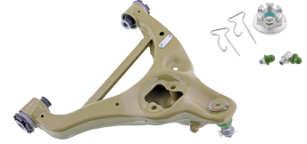
CTXMS401205/CTXMS401206 - DELANTERO INFERIOR I/D FORD F-150 2020-2015