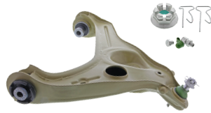
CTXMS40170/CTXMS40171 - FRONTAL INFERIOR I/D FORD F-150 2013-2009