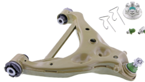
CTXMS401114/CTXMS401115 - FRONTAL INFERIOR I/D FORD F-150 2015-2014