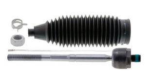
TXMS40708 - INTERIOR DELANTERO FORD F-150 2016-2009